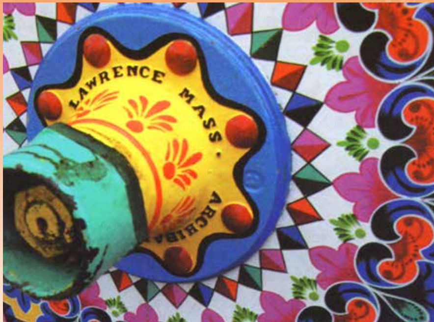
Detalle de un eje de carreta. Tomado de Boyeros, bueyes y carretas. Por la senda del patrimonio intangible de Cecilia Dobles Trejos, Carmen Murillo Chaverri y Guiselle Chang Vargas, publicado en el 2008