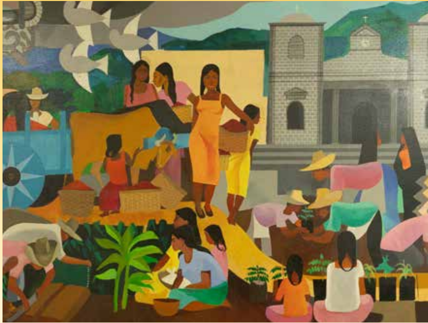
Detalle del mural "Palmares", Luis Daell Obra muralista que resalta los elementos básicos de la herencia cultural y contribuye al mejoramiento de la identidad local del cantón de Palmares