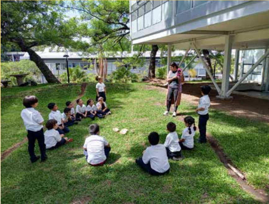
Estudiantes de la Escuela Dante Alighieri Costa Rica realizan un separador de libros como actividad final del taller literario