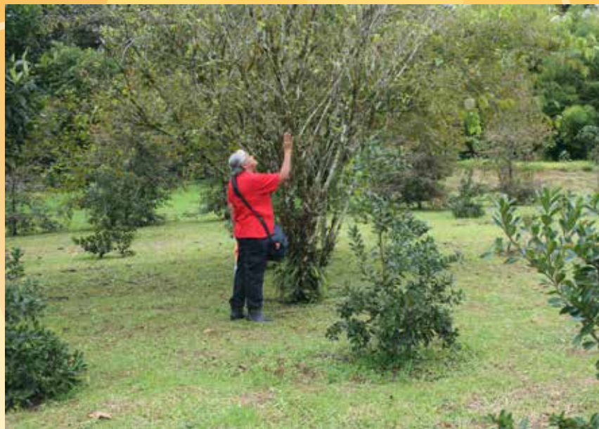
Una estudiante del Programa Integral del Adulto Mayor (PIAM) participa en un taller y en un recorrido guiado del Museo UCR en la Finca Experimental Fraijanes.

“Aprender haciendo” es la premisa fundamental que guía la experiencia pedagógica de un taller, donde las personas participantes tienen un rol activo y dinámico en su proceso de aprendizaje. Este se caracteriza por permitir la experimentación, la curiosidad, el asombro, la indagación, la construcción y el compartir saberes, entre las personas que participan y la que facilita el espacio educativo. Los talleres con personas de todas las edades han sido parte fundamental de las acciones educativas desarrolladas por el Museo UCR, durante sus 25 años de trabajo continuo.