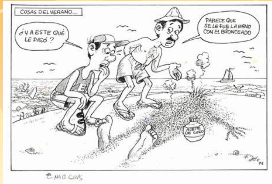
Fernando Zeledón Guzmán "Cosas del verano" Tinta china sobre papel lino 1998