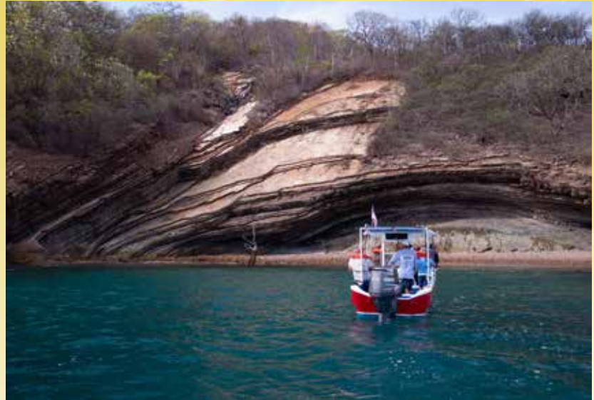
Capacitación sobre la “Ruta geológica con medios digitales”, dirigida a diversos grupos organizados de la zona norte de Guanacaste. Actividad desarrollada en colaboración con el Centro de Investigación en Ciencias Geológicas (CICG) de la UCR

Desde el Museo UCR, se diseñan y desarrollan diversas propuestas de capacitación para sectores y grupos variados de la población costarricense, por ejemplo, desde trabajadores en museos hasta grupos organizados en comunidades. Un caso fue la capacitación “Ruta geológica con medios digitales”, en la cual se trabajó con guías turísticos, mujeres y jóvenes líderes de la comunidad de Cuajiniquil, Guanacaste. El objetivo era mostrar la riqueza geológica de la zona norte de Guanacaste y capacitar sobre el uso de una aplicación y página web como recurso para la actividad turística y educativa. Las actividades de capacitación han sido parte fundamental de las acciones educativas desarrolladas por el Museo UCR, durante sus 25 años de trabajo continuo.