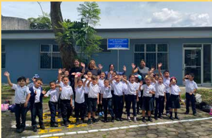
Estudiantes de primer grado de la Escuela Dante Alighieri Costa Rica, quienes participaron en el taller literario organizado por el CIRCA-CIICLA

El módulo operativo del CIICLA, Centro de Información y Referencia sobre Centroamérica y el Caribe (CIRCA), en conmemoración del Día del Medio Ambiente (05 de junio del 2023), realizó un taller literario sobre el cuento “Mar de plástico”, el cual fue impartido a dos grupos de primer grado de la Escuela Dante Alighieri Costa Rica, es decir, a estudiantes de 6 y 7 años. El objetivo fue concientizar sobre el papel que tenemos como individuos en la conservación del medio ambiente y, a su vez, generar estrategias y espacios de inclinación por la lectura de una manera lúdica.